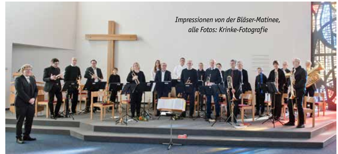
Impressionen von der Bläser-Matinee, alle Fotos: Krinke-Fotografie