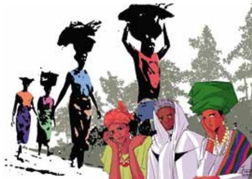
Erholung für die Müden