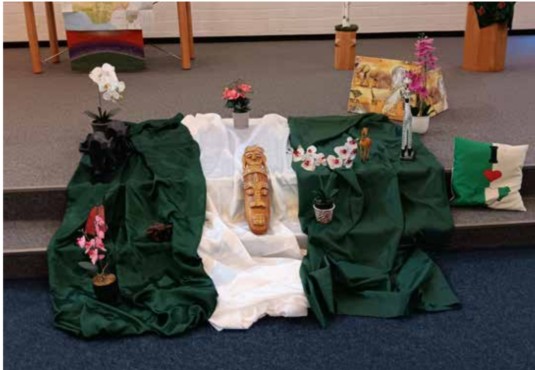
Geschmückter Altarraum zum Weltgebetstag