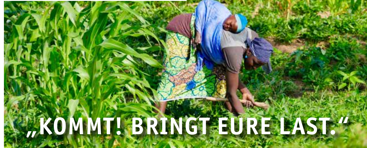
Erfolgreicher Maisanbau: Bäuerin mit ihrem Baby auf ihrem Feld

Nigeria ist das bevölkerungsreichste Land Afrikas, – vielfältig, dynamisch und voller Kontraste. Mit über 230 Mio. Menschen vereint der „afrikanische Riese“ über 250 Ethnien mit mehr als 500 gesprochenen Sprachen. Die drei größten Ethnien sind Yoruba, Igbo und Hausa, aufgeteilt in den muslimisch geprägten Norden und den christlichen Süden. Außerdem hat Nigeria eine der jüngsten Bevölkerungen weltweit, nur 3% sind über 65 Jahre alt. Dank der Öl-Industrie ist das Land wirtschaftlich stark, mit boomender Film- und Musikindustrie. Reichtum und Macht sind jedoch sehr ungleich verteilt.