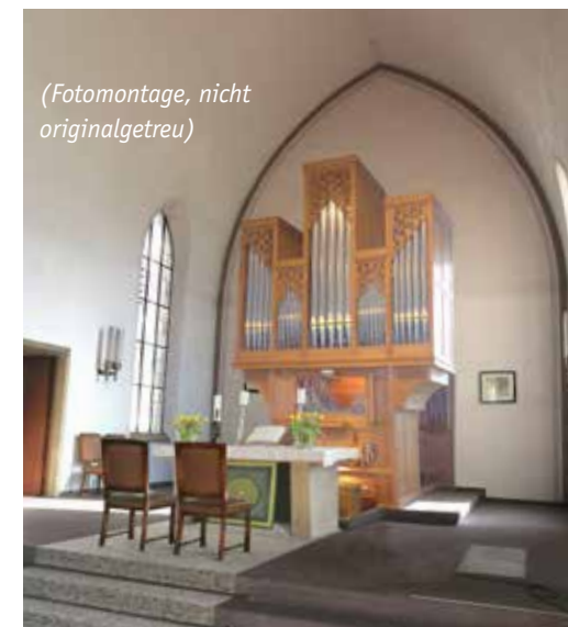
(Fotomontage, nicht originalgetreu)