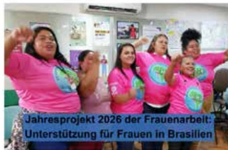
z. B. die Müllsammlerinnen von Porto Alegre