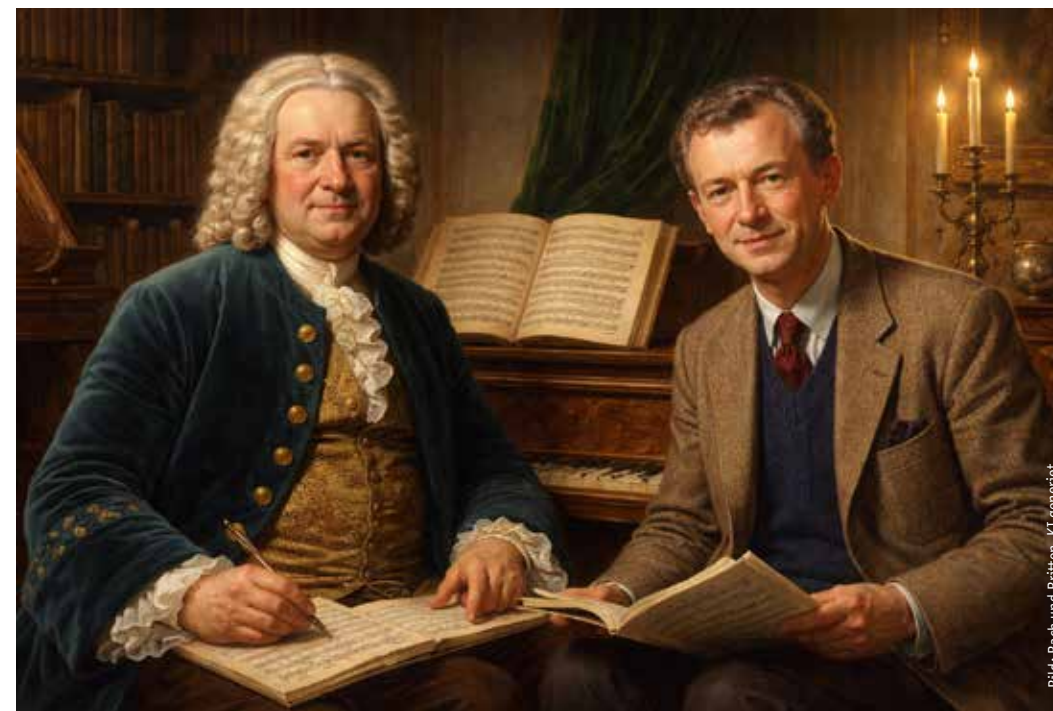
Bild: Bach und Britten, KI generiert