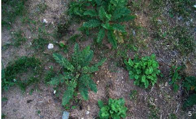
Blattformen im Rosettenstadium

Der Stängel ist an der Basis rötlich, ansonsten grün, kantig gerillt und teilweise spinnwebartig behaart. Die Stängellänge liegt zwischen 20 und 130 cm.