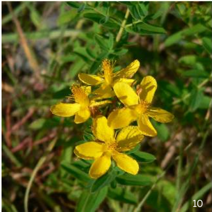
Johanniskraut ( Hypericum spec. )