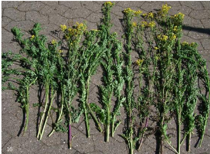
15 Triebe entsprechen 1000 g Frischmasse oder 150 g Trockenmasse

Die Gefahr ist erheblich, wenn man sich vor Augen führt, dass ein einzelner ausgewachsener Trieb im Mittel etwa 70 g Frischmasse oder 10 g Trockenmasse wiegt. Die auf dem Foto unten gezeigten 15 Triebe haben zusammen bereits ein Frischgewicht von 1000 g.