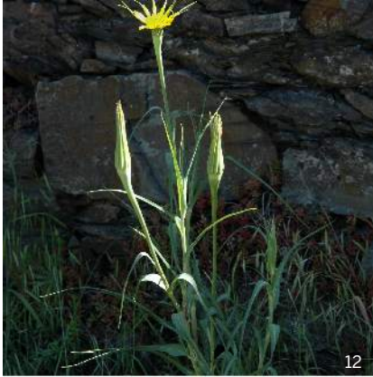
Wiesen-Bocksbart ( Tragopogon pratensis )