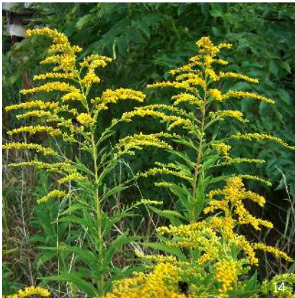
Kanadische Goldrute ( Solidago canadensis )