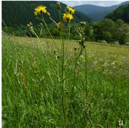
Wiesen-Pippau ( Crepis biennis )