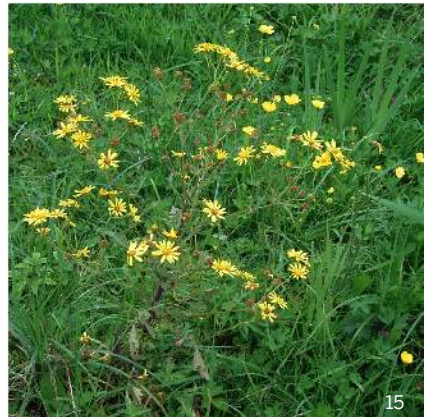
Abspreizendes Kreuzkraut ( Senecio erraticus )

Verwechslungsmöglichkeit mit weiteren Senecio-Arten, die aber ebenfalls giftig sind, ist unter anderem Abspreizendes Kreuzkraut ( Senecio erraticus ).