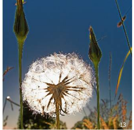
Wiesen-Bocksbart in der Samenreife