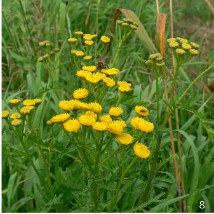
Rainfarn ( Tanacetum vulgare )